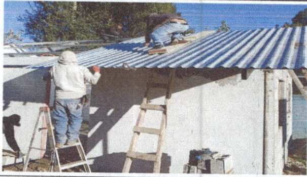
Foto1: sustitucion de lámina, por lamina troquelada aluzinc calibre 26